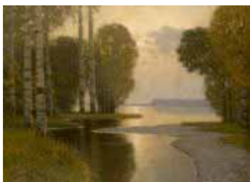
Ainava ar bērziem. Ap 1910.