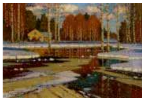
Pavasara ainava (Marts). 20.gs. 30.gadi.