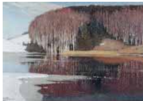
Pavasara ūdeņi (Maestoso). Ap 1910.